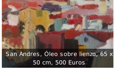
San Andres, Óleo sobre lienzo, 65 x 50 cm, 500 Euros